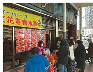
友好都市花巻の物産と観光展