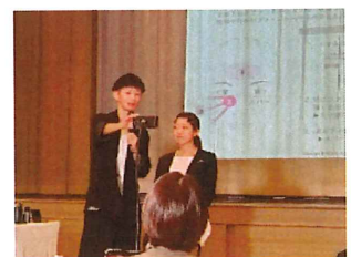
特別美容セミナー