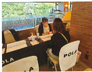
ハンドトリートメントブース