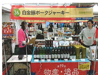
物産・逸品見本市