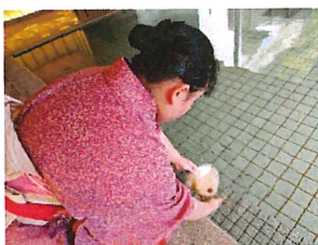
入湯チェックの様子