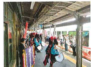
陽旅(ひなび)おもてなし