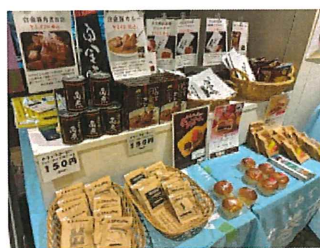
いわて銀河プラザ花巻物産展