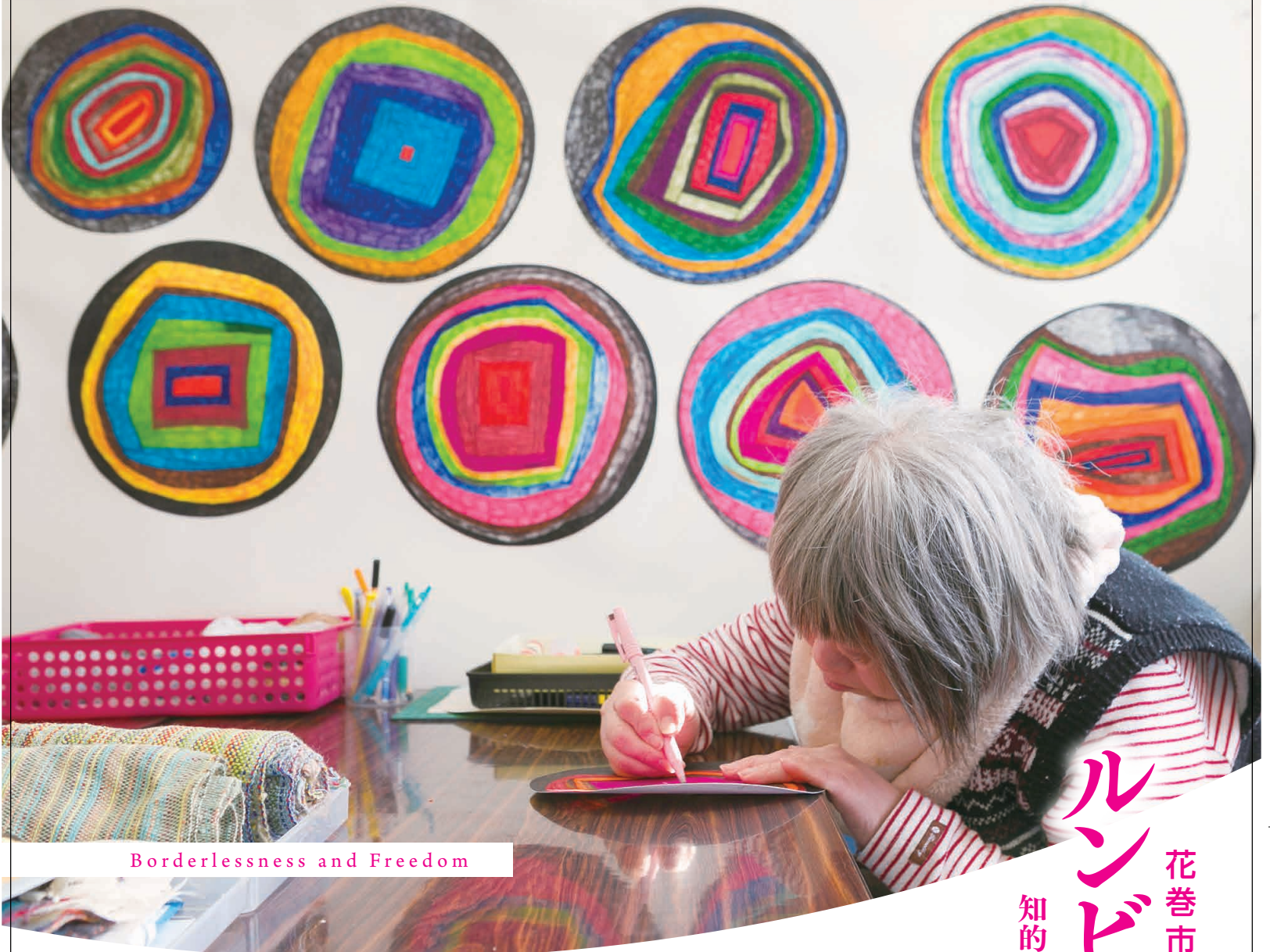
Borderlessness and Freedom

Lumbinic Artists BORDERLESS ART COLLECTION