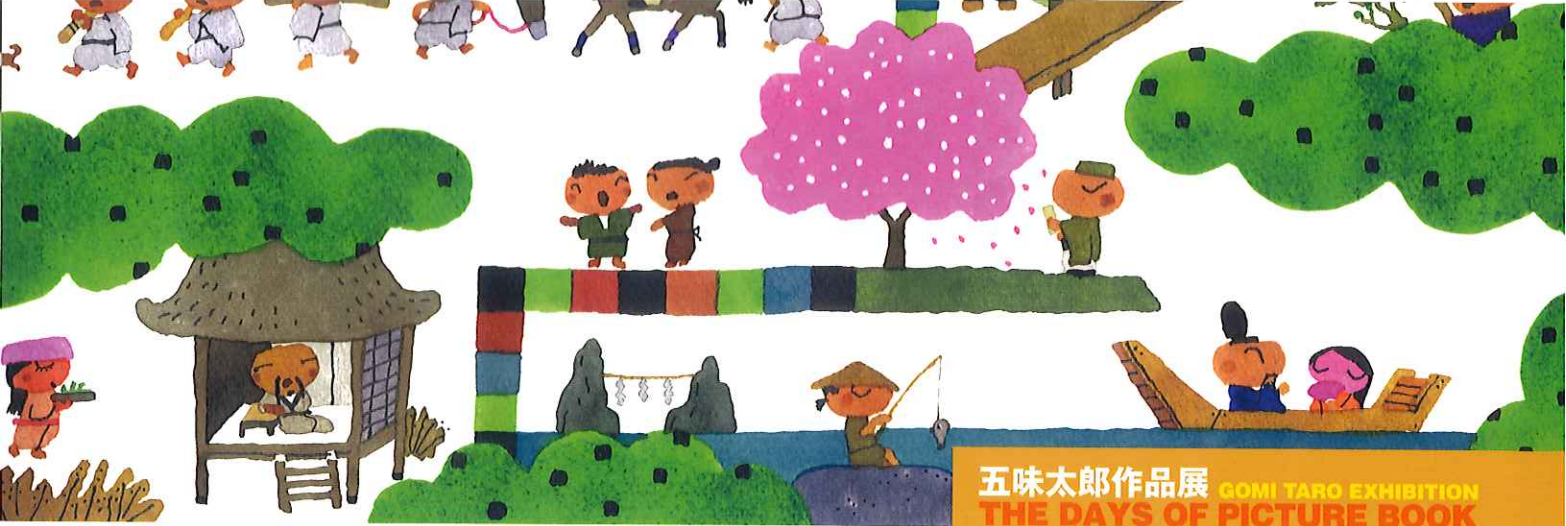
「百人一首ワンダーランド」2014 東京書籍