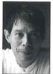
五味太郎 Gomi Taro

五味さんは1973年に絵本作家としてデビューして以来、子どもの目線に寄り添った作品を数多く出版しています。子どもには絵本を読む楽しさを、大人には忘れていた子ども心の再発見をもたらしてくれます。絵本原画、国内外で出版された絵本を展示するコーナーなど五味さんの世界を堪能できる内容です。五味太郎ワールドをお楽しみください。