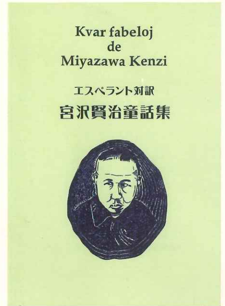
『エスペラント対訳宮沢賢治童話集』