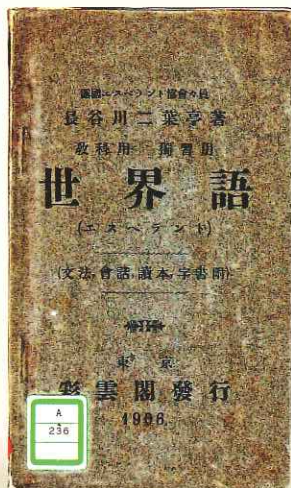
二葉亭四迷『世界語』