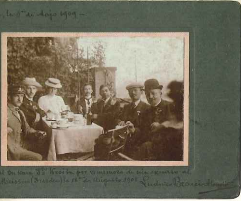
第4回世界エスペラント大会に出席した 新村出(国語学者)と黒板勝美(歴史学者)