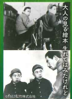
大人 の 見 る 繪 本 生 れ て は み た け れ ど