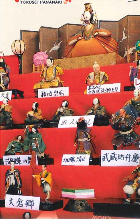
大迫宿場の雛まつり