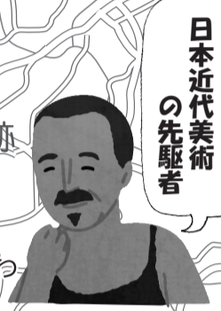
萬鉄五郎 日本近代美術 の先駆者