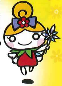
花巻市公認キャラクター フラワーロールちゃん